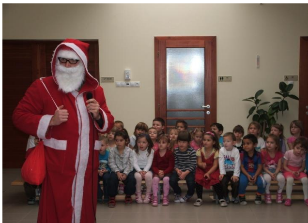
Megjött a Mikulás bácsi 2016