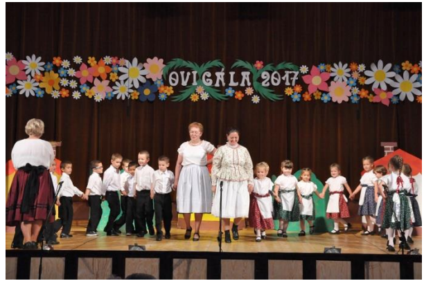
OVIGÁLA I. 2017