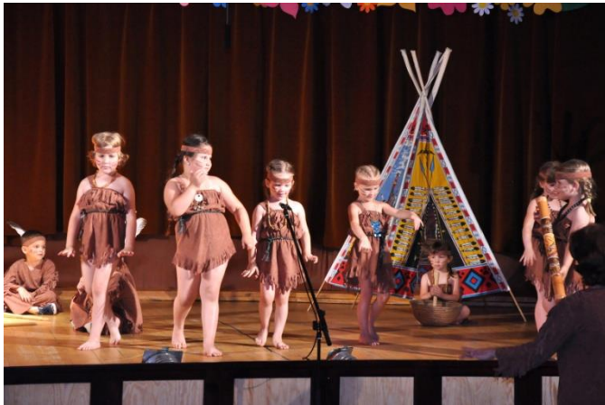
OVIGÁLA II. 2017