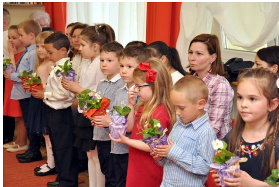
Anyák napja 2017