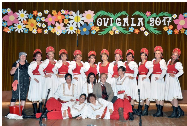
Felnőttek az ovigálán